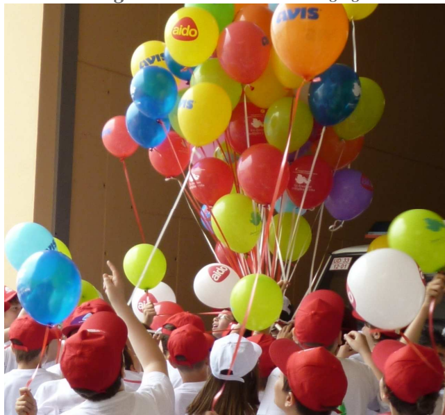
Manifestazione organizzata dall'A.S.S. n.5-Bassa Friulana in collaborazione con la Direzione Didattica di Palmanova, il Comune, il Centro Trapianti R. e le Associazioni di Volontariato.